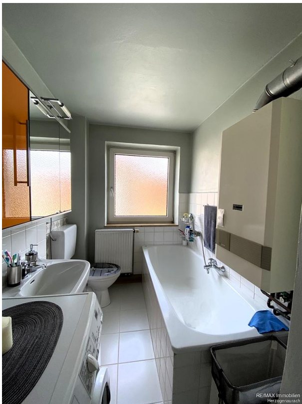
RE/MAX Immobilien Herzogenaurach