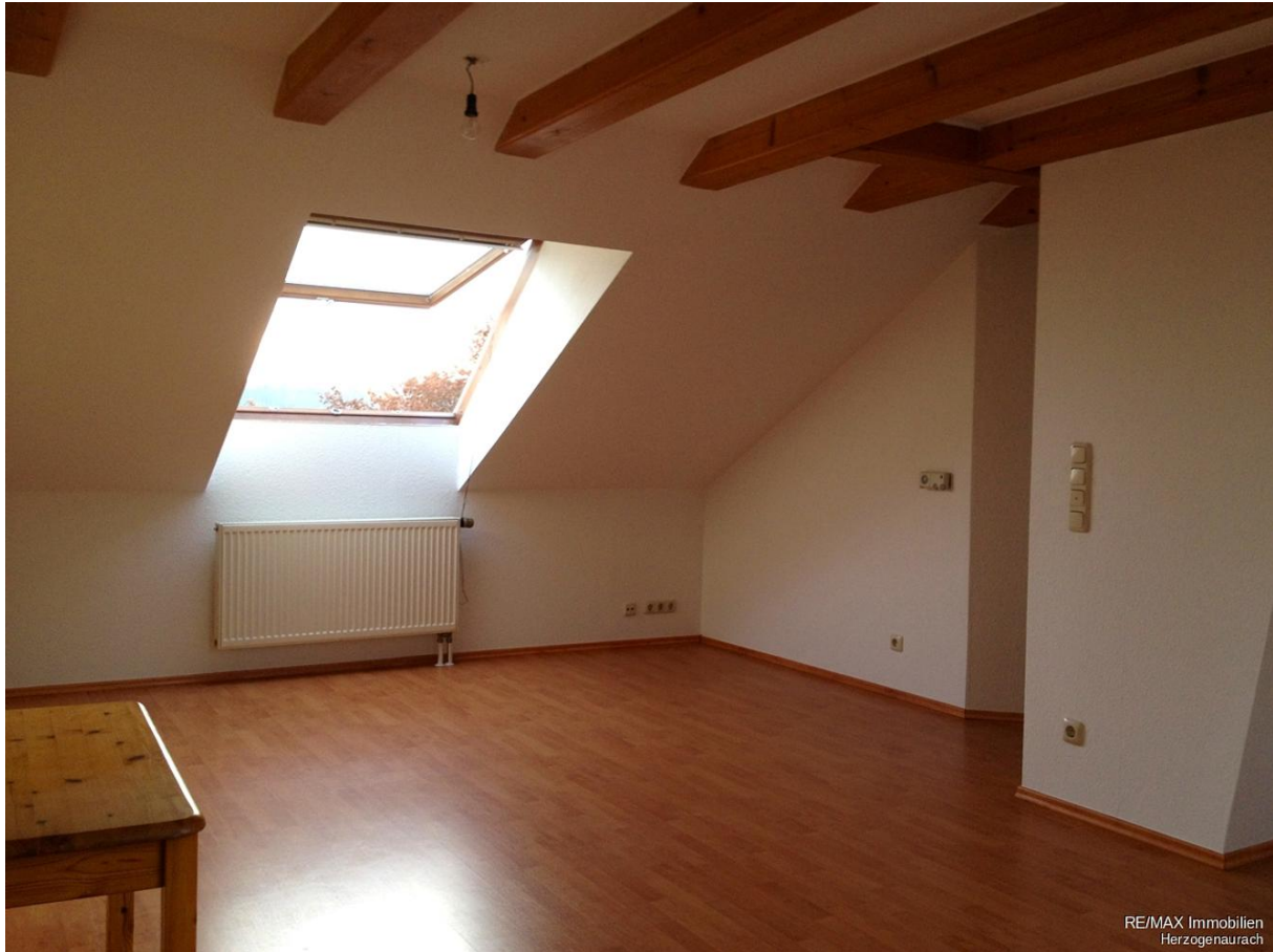
RE/MAX Immobilien Herzogenaurach