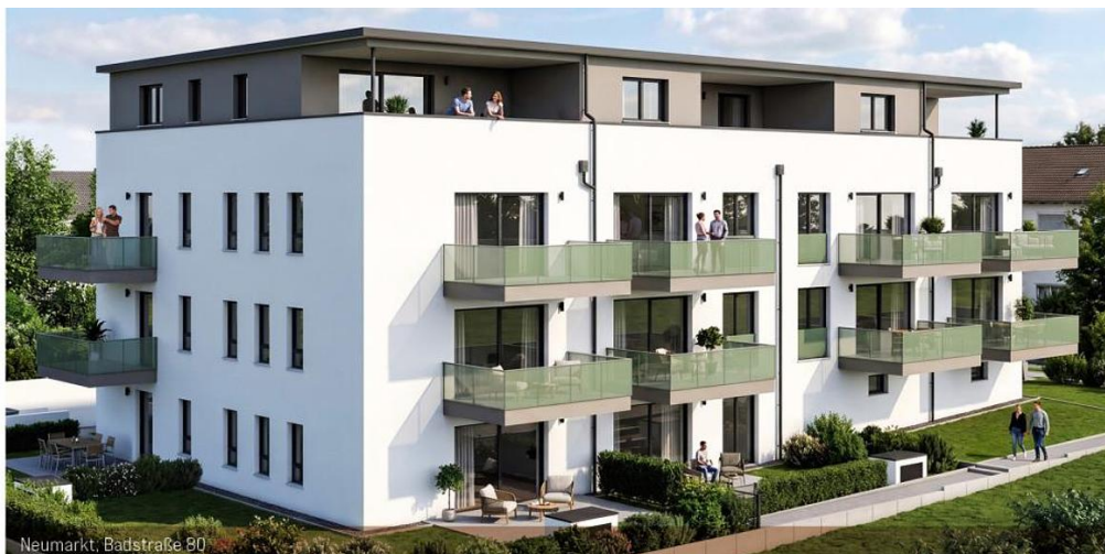
Neumarkt, Badstraße 80