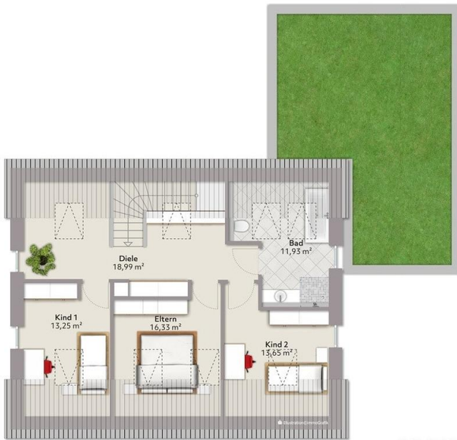
Exposplan, nicht maßstäblich