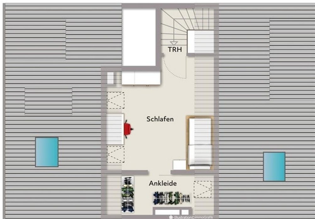
Exposéplan, nicht maßstäblich