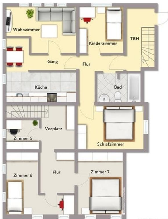
Exposiplan, nicht maßstäblich