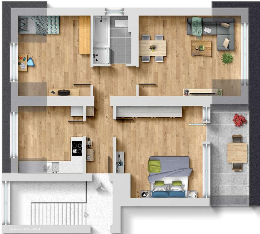
Illustration © ImmoGrafik