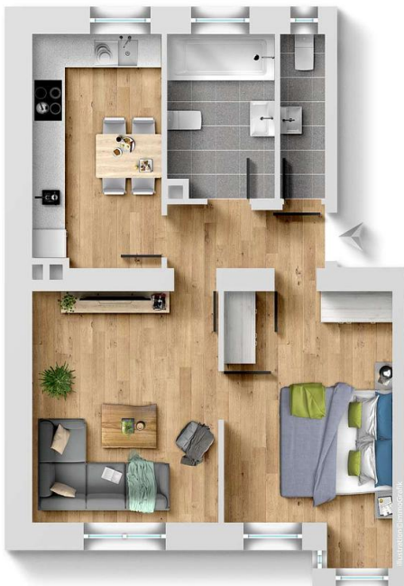
Exposplan, nicht maßstäblich