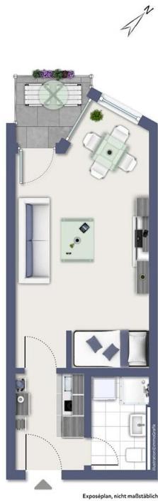
Exposplan, nicht maßstäblich