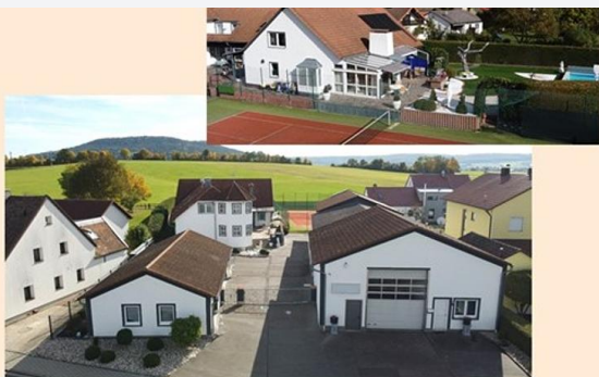
Freystadt - Forchheim

Vielseitiges Unternehmer-Anwesen in Bestzustand